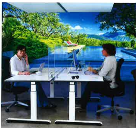
▲ Motivierende Arbeitsplätze zum Wohlfühlen

Otto Kasper: WORKPLACE® LIVING - Design, Lighting, Acoustics Deutsch/Englisch Rund 220 farbige Abb., 276 Seiten, Hardcover ISBN 978-3-947572-66-3